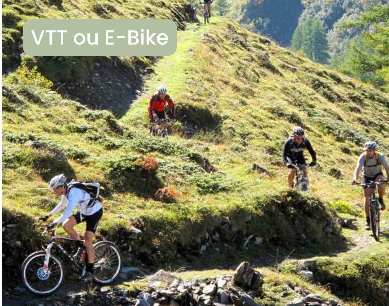
VTT ou E-Bike