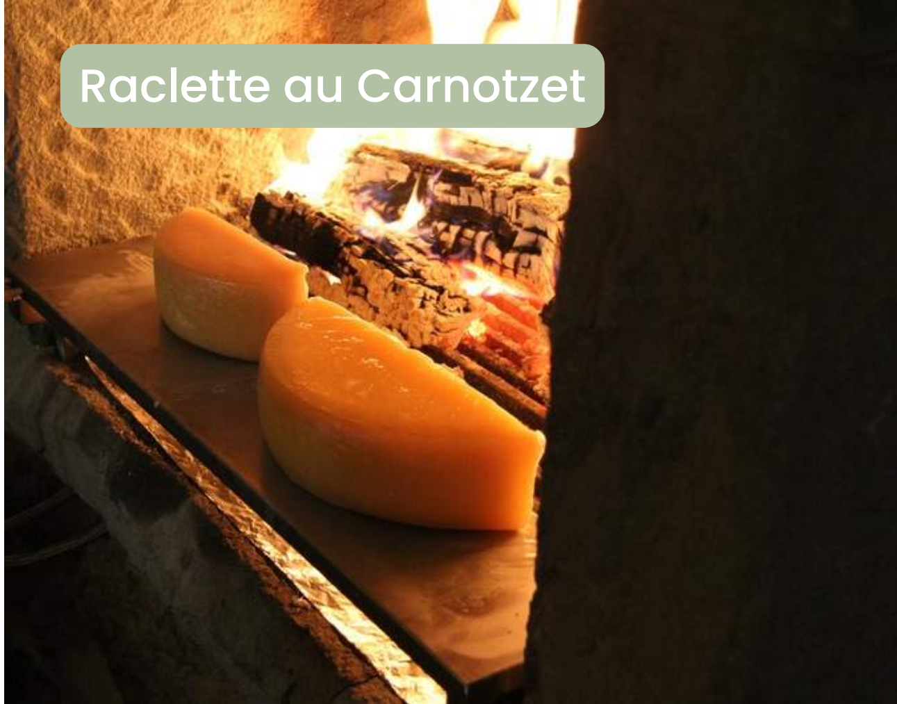
Raclette au Carnotzet