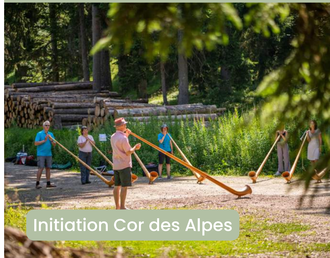
Initiation Cor des Alpes