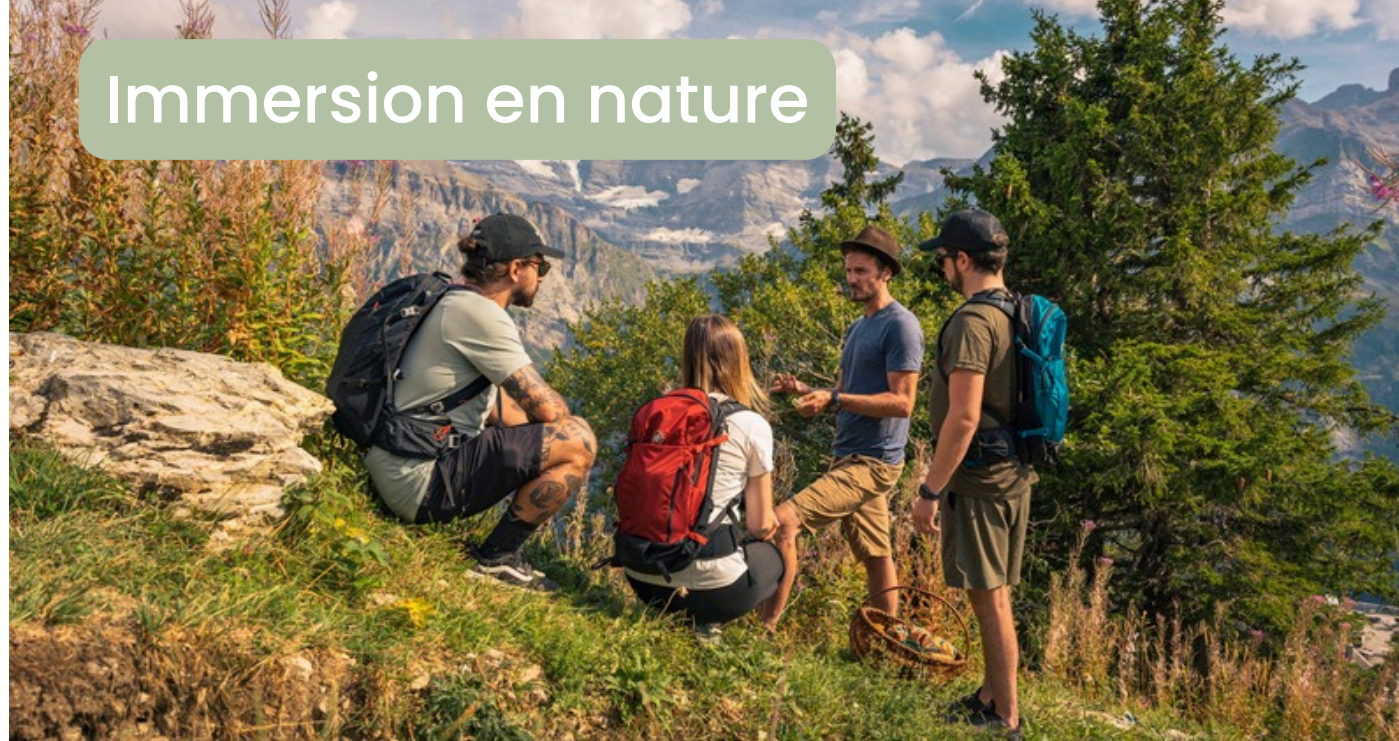
Immersion en nature