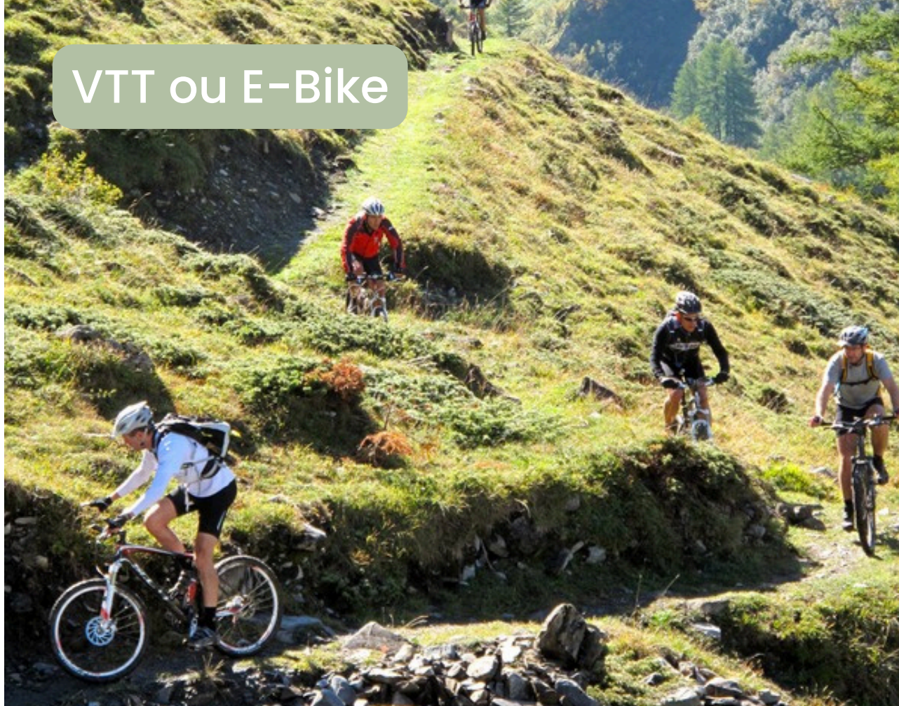
VTT ou E-Bike